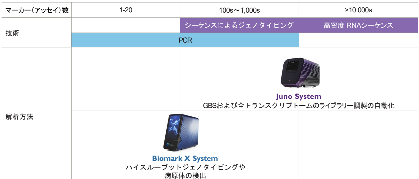
Figure 1. Biomark X System と Juno Systemが、少アッセイから多アッセイの分析のニーズまで、完全なソリューションを提供。